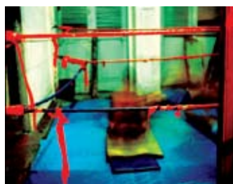
Da Série Santa Rosa, 1993

centistas. Na década de 1950 evoluiu para o abstracionismo geométrico, de que é exemplo a série de bandeiras e mastros de festas juninas, que se transforma, nos anos 60, em esquemas óticos e vibráteis puramente cromáticos, característicos de sua obra. a